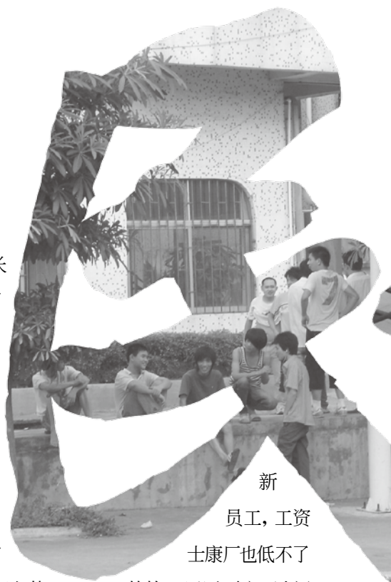
新 员工，工资 士康厂也低不了

现在，我们机构主要的民工事工就是训练民工宣教士，一方面建造他们能有扎实的信仰，努力工作，在工作中展现美好的品行和人格；另一方面还要求他们要影响身边的人，帮助他们认识耶稣基督，并能在耶稣的感召之下改变生命，过一个圣洁而有目标的生活。