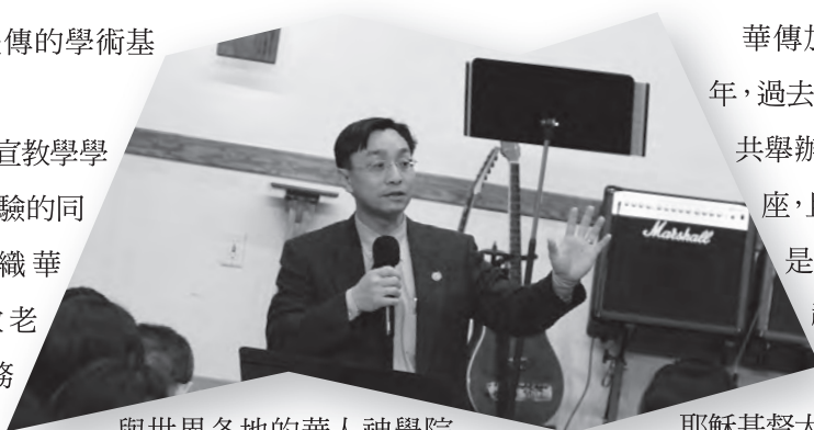
與世界各地的華人神學院

夥伴合作，教授差傳課程，強化神學院的宣教學系，並配合華傳的宣教工場，作為神學生的宣教實習場地。